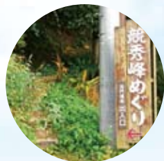
登山口 (青の洞門入口前)